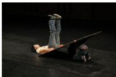
振子びじん 横浜ダンスコレクション EX2011 コンペティション I 作品部門 審査員賞